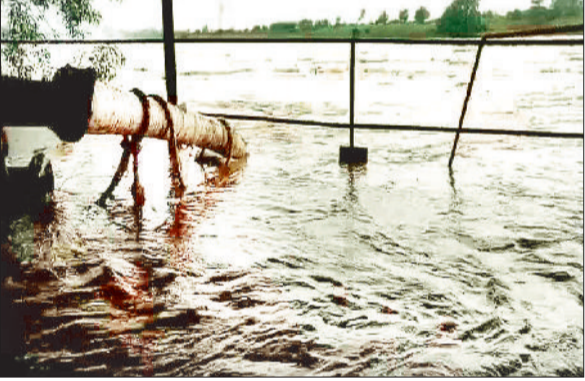
तेज धार से बहता रेड़ नदी का पानी।

सूचना संबंधित व्यक्ति को अवश्य देने को कहा। जनदर्शन में कुल 42 आवेदन प्राप्त हुए। इसमें मुख्य रूप से शाला में प्रवेश, राजस्व संबंधी मामले, भूमि विवाद, सीमांकन, कब्जा हटवाने, टांसफार्मर लगवाने, महतारी वंदन, जल जीवन मिशन अंतर्गत नल लगवाने, आपदा क्षतिपूर्ति अंतर्गत मुआवजा प्राप्ति आदि समस्याओं के निराकरण संबंधित मामले संबंधित अन्य विभिन्न विषयों से संबंधित मांगें शामिल थीं।