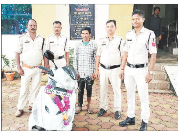
पुलिस गिरफ्तार में आरोपी।

जिले के कांसाबेल थाना क्षेत्र में गौवंश मांस की तस्करी कर रहे एक व्यक्ति को पुलिस ने रंगे हाथों पकड़ने में सफलता प्राप्त की है। ऑपरेशन शंखनाद के अंतर्गत की गई इस कार्यवाही में पुलिस ने 17 किलो प्रतिबंधित गौ मांस बरामद करते हुए आरोपी को गिरफ्तार कर न्यायिक रिमांड पर जेल भेज दिया है।