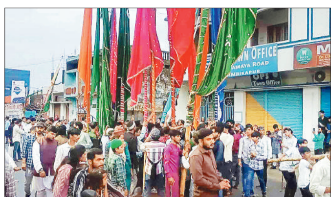
जुलूस में शामिल समाज के लोग।